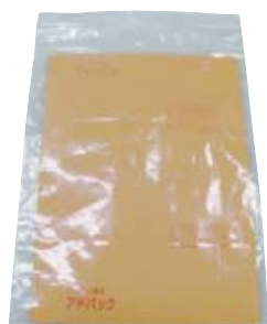
Y1-L (アドフィルム(チャック付ポリ袋入防錆紙))