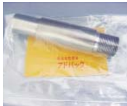
防錆紙を使用した場合