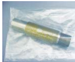
防錆紙を使用していない場合